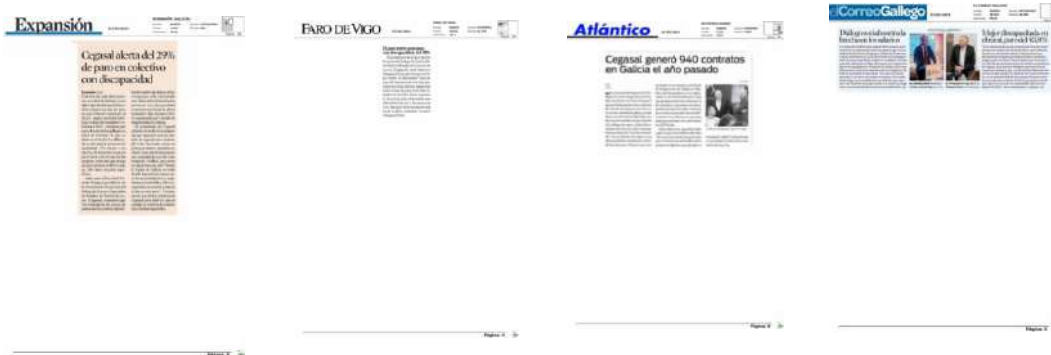
12/02/2019 Noticia de La Expansión sobre os CEEIs de CEGASAL